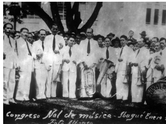
Fig. 5 Banda musical en la Plaza de Bolívar durante el Primer Congreso Nacional de la Música. Realizado en Ibagué.