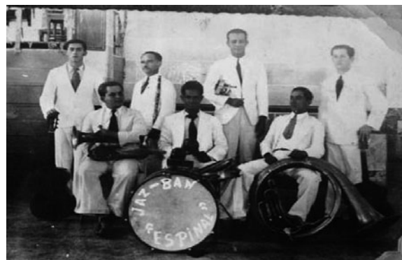
Fig. 9 Jaz- Ban del Espinal (sic)

La imposibilidad de realizar unos programas y el incumplimiento de algunos de sus miembros por ser a tan tempranas horas la grabación, obligaron al maestro Sánchez a trasladar el horario a la tarde y a cambiar el nombre del programa por el de Tardes Tolimenses .