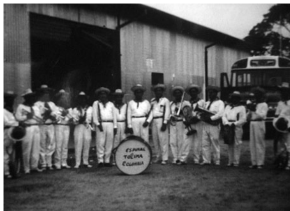
Fig. 8. Banda del Espinal partiendo hacia Venezuela.