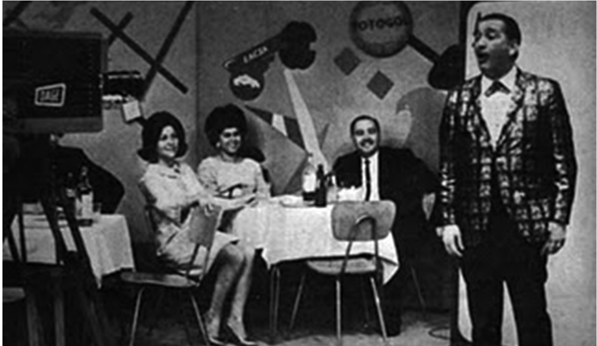
Figura 3. Emisora Nueva Granada. Año 1965.

indagar por el sentido que en un determinado momento de su experiencia personal, como habitante tradicional o como inmigrante, pudo darle a los estímulos sonoros una determinada persona. En ese sentido no son tanto el origen social u otras condiciones externas las que van a permitir que una persona tenga una mayor o menor recordación de los sonidos o una más amplia comprensión de su significado, es la intensidad o frecuencia con la que cada individuo se relacionó en su experiencia cotidiana con ese sonido que ahora recuerda.