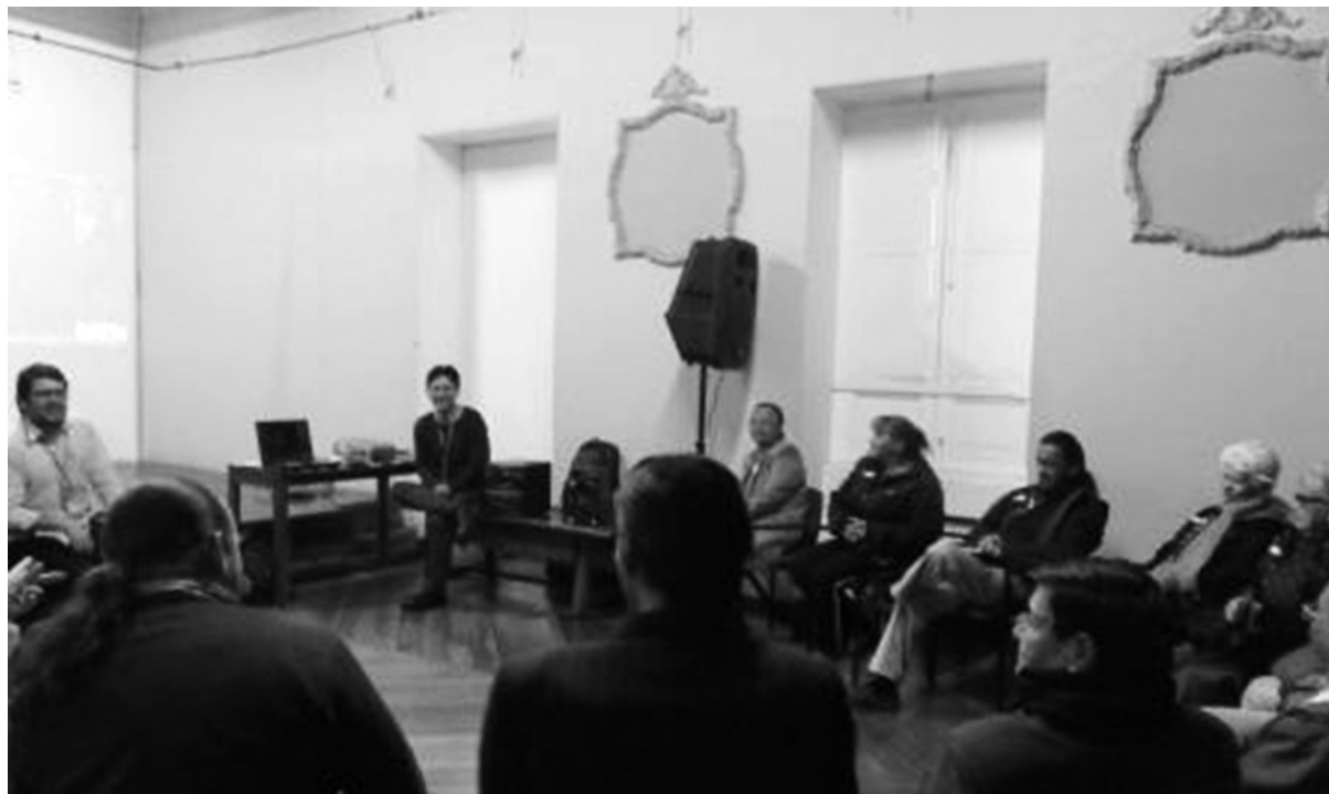
Figura 2. Asistentes al conversatorio realizado en la Localidad La Candelaria