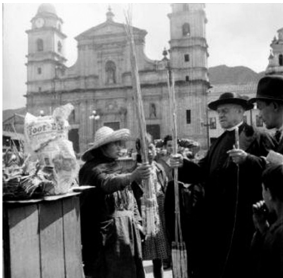
Figura 5. Plaza de Bolívar – Catedral. Año 1946

Finalmente, con las personas mayores participantes de los conversatorios se tuvo la posibilidad de conocer de viva voz no sólo cuáles fueron esos elementos sonoros sino también cómo se relacionaron y que sentido le dieron a ellos como parte de su experiencia de vida. De esta forma el presente trabajo se convirtió en un acercamiento al pasado de Bogotá, a sus habitantes y a su entorno desde una perspectiva que puede enriquecer nuestra identidad cultural y el sentido de apropiación patrimonial del territorio que habitamos.