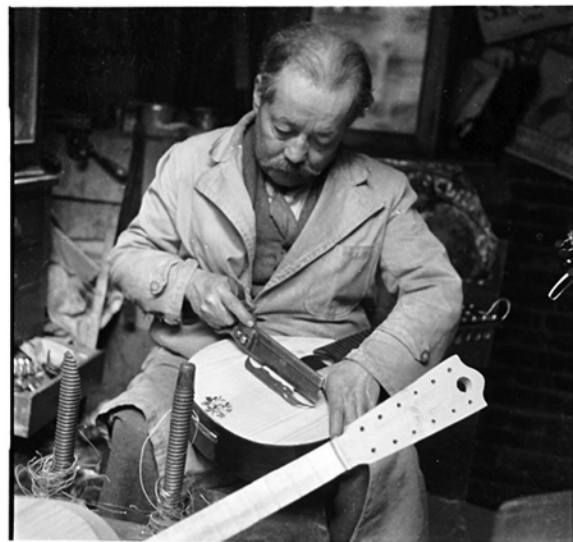
Figura 4. Fabricante de instrumentos barrio La Candelaria. Año 1956.

El paisaje sonoro que recrean las personas mayores en sus evocaciones tiene como referentes a una ciudad y una cultura que pueden considerarse por momentos idílicas o idealizadas, al tratar de evocar elementos casi desaparecidos de estas. Sin embargo, su vigencia se hace plena cuando son las mismas personas mayores, desde su identidad generacional y poblacional, quie-