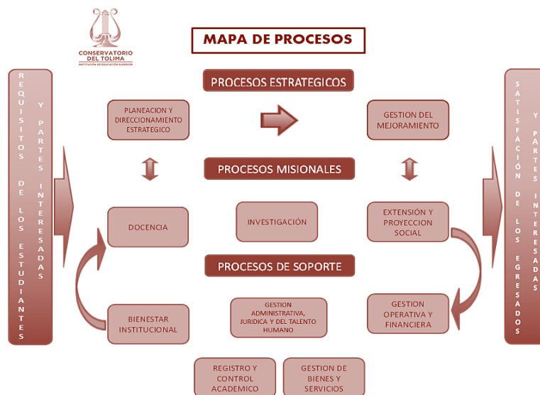
Gráfica 1. Mapa de Procesos del Conservatorio del Tolima.