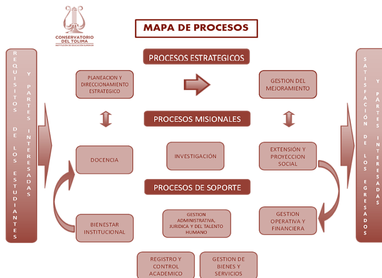
Gráfica 1. Mapa de Procesos del Conservatorio del Tolima.