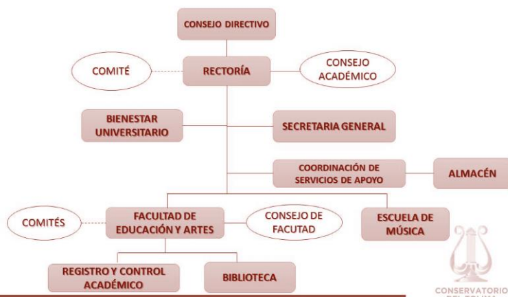
Gráfica 2. Estructura Organizacional del Conservatorio del Tolima.