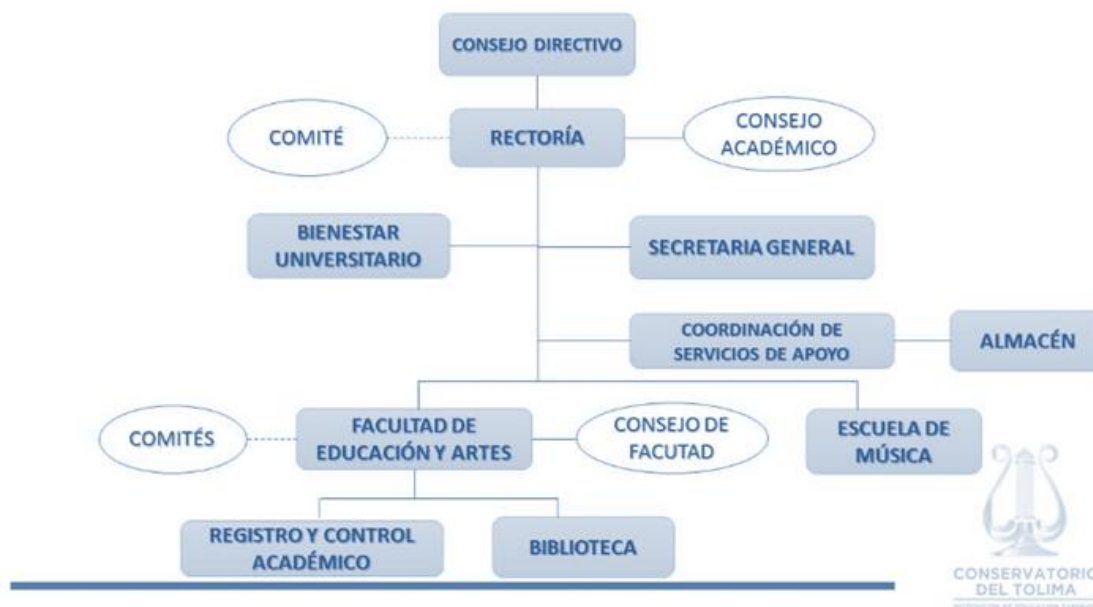
Gráfica 2. Estructura Organizacional del Conservatorio del Tolima.